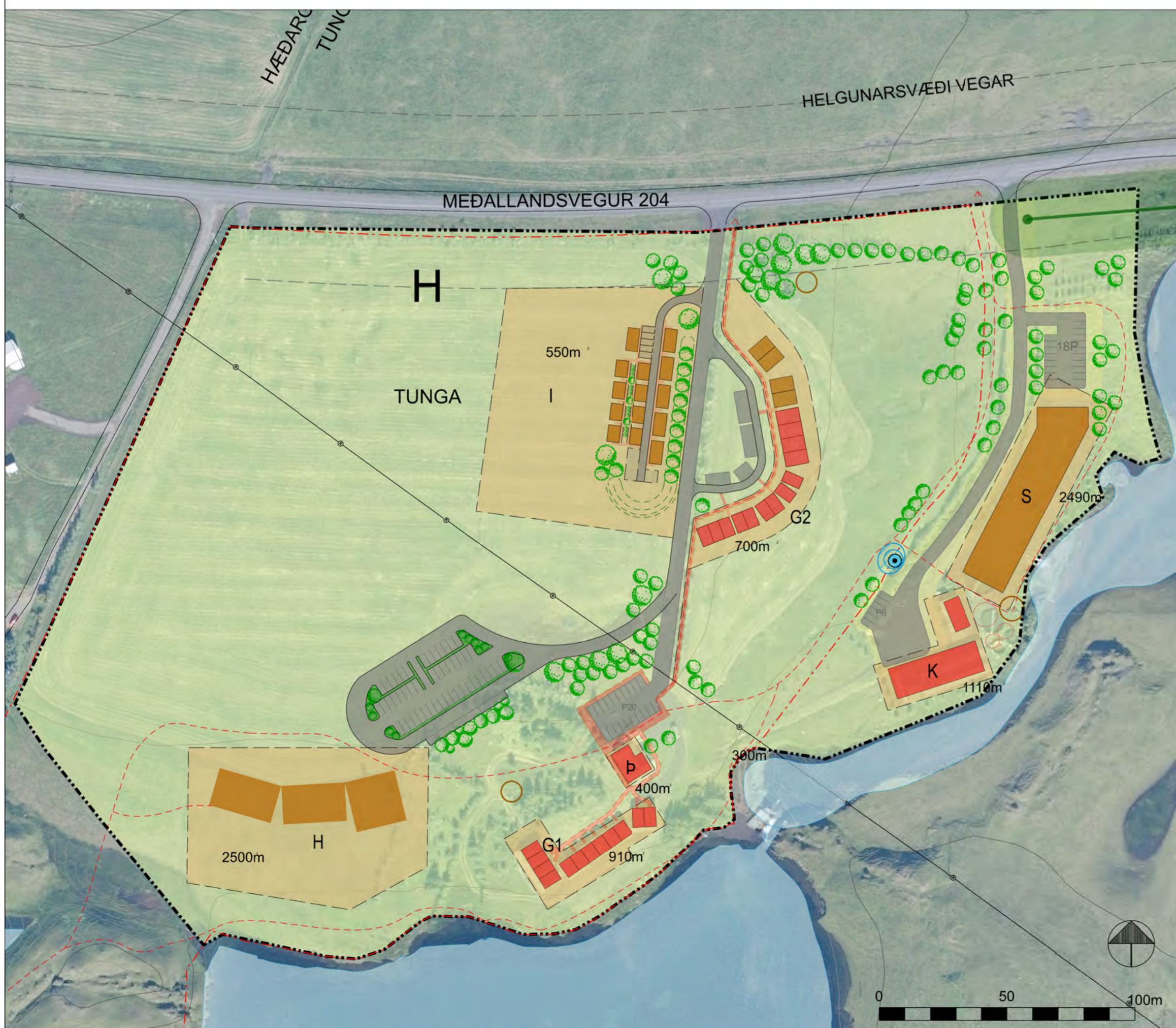
Breyting á deiliskipulagi í landi Tungu, mkv. 1:1500.