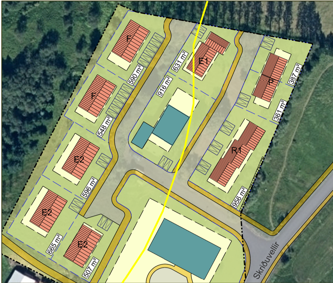
Samþykkt deiliskipulag frá 10.júní 2021, mkv. 1:1000 A3

Tveimur einbýlishúsalóðum breytt í tvær fjölbýlis- húsalóðir og 3ja íbúða raðhúsalóð breytt í 4ja íbúða raðhúsalóð